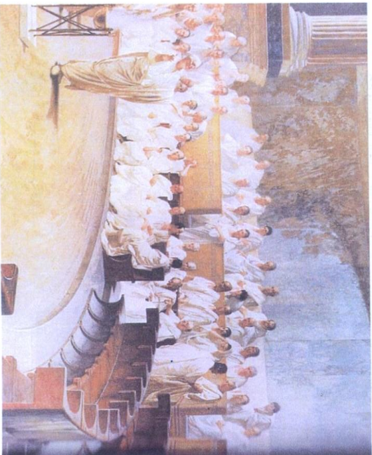
عائلان من بكارويجا يمتثلان على مقعدين بمجلس التبرج الروماني

16 افريل 2015 على الساعة التاسعة صباحا بالمعهد العالي للعلوم الانسانية بجندوبة